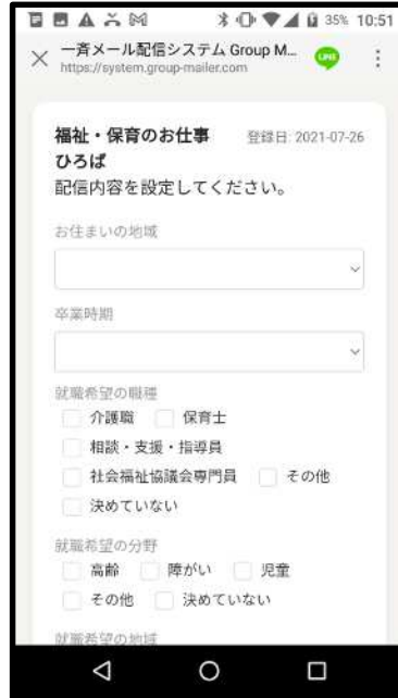
②「お住まいの地域」「卒業時期」「就職希望の職種」「就職希望の分野」「就職希望の地域」を選択のうえ、「保存」をクリック。